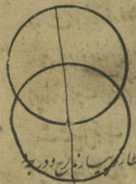
و در تقویم موضع راس بعد از تقویم عطار راس را بر جی در جی

بگذرد و آنرا منقطه البروج خوانند و ماه را ماهی دیگر باشد که با مدار آفتاب در دو موضع تقابل کند یکطرفه است و آن دو تقاطع را جوزهرین و عقده تین خوانند بس که نیمه از مدار ماه در جانب شمالی و از مدار آفتاب و نیمه دیگر در جانب جنوبی آن عقده را که چون ماه از آن بگذرد و شمالی بود راس خوانند و آن عقده را که چون ماه از آن بگذرد جنوبی شود و جنب خوانند و مقدار دوری ماه از مدار آفتاب عرض خط و عاتش پنج درجه بود و تقویم ماه را طول ماه خوانند و راس تقویم را سیری معکوس بود مانند گوگردی در نوزده سال و بر جی در نوزده ماه و در جی در نوزده روز قطع کند تقویم و صورتش